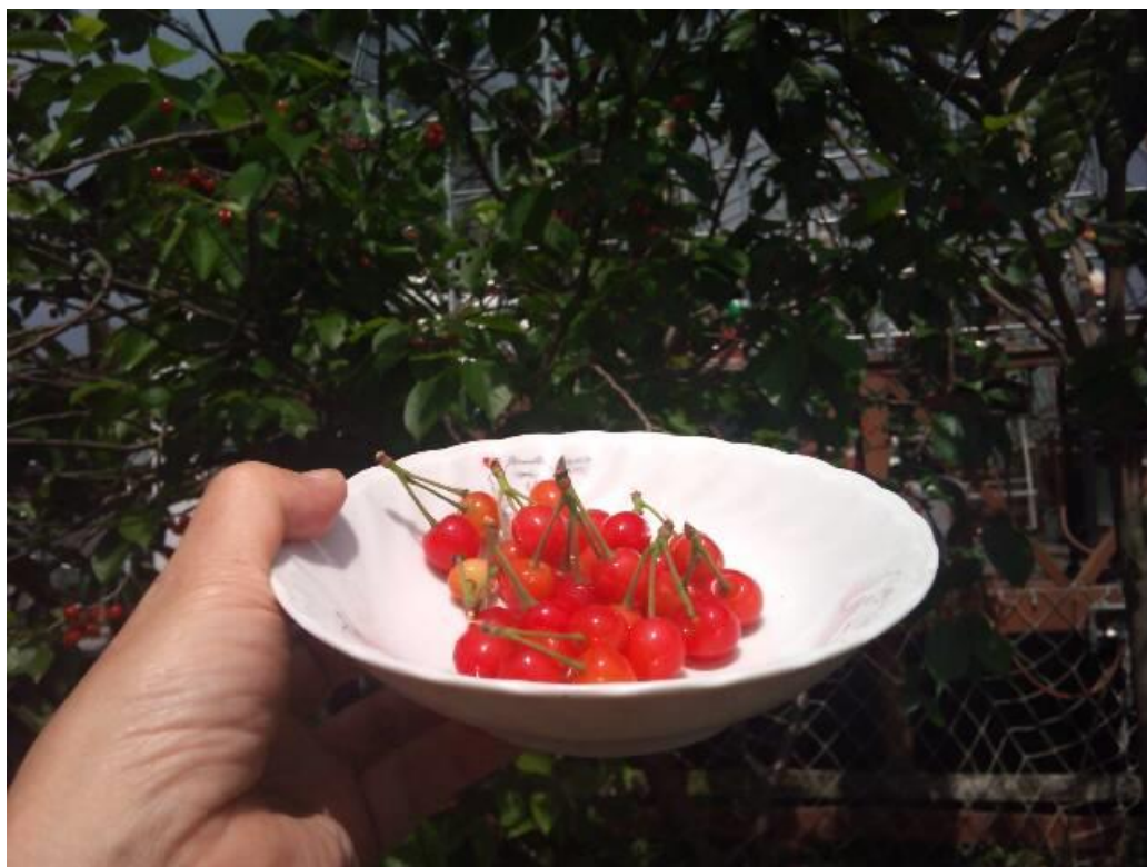
指先より小さいマイクロミニトマト