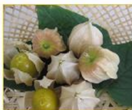
中 ホウズキトマト