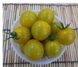
中 イエローミニトマト