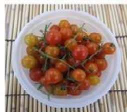
小 マイクロトマト